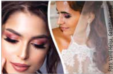
A csodálatos ruhaköltemény, a jól megválasztott smink és frizura igazi harmóniát tükröz

A smink kiválasztása azonban nagyban függ a menyasszonyi ruha