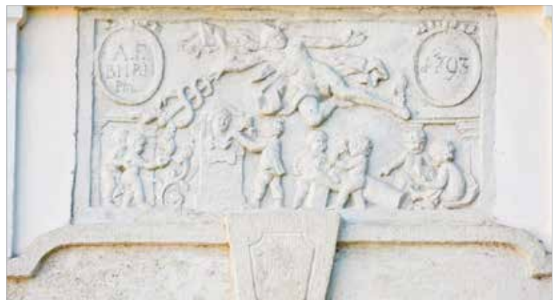
Az alkotást húsz éve restaurálták, most is teljes szépségében látható

Andreas Fligl további fehérvári alkotásai a Püspöki Palotát díszítik.