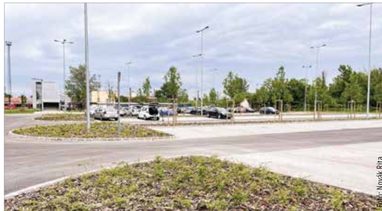
A környezetre is odafigyeltek: mintegy száz fát, kétezer cserjét és közel négyezer évelő növényt telepítettek

„A következő lépésnek az intermodális csomópontnak kellene lennie. Kérdés, lesz-e rá pénz, és ha igen, mikor. Mivel ez alapjaiban reformálná meg városunk, sőt vármegyénk közösségi közlekedését, folytatni fogjuk a beruházásért való lobbizást, hiszen ez több száz ezer ember érdeke!” – hangsúlyozta a polgármester.