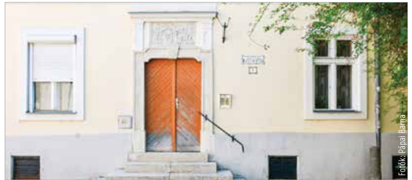
A ház műemlékvédelem alatt áll

így is nyilvántartja tíz alkotását, melyek közül hat Székesfehérváron található. Az egyik legismertebb ezek közül éppen a korábbi házán látható. Nyugodtan kijelenthetjük, hogy a bejáratot díszítő, Kőfaragó névre keresztelt domborművet saját magának készítette a művész. Az alkotás 2004-ben restauráláson esett át, így napjainkban is nagyon szép állapotban van. Erdemes elidőzni részletgazdag kidolgozásán, a kor szellemét visszaidéző hangulatán. A Kőztérkép így írja le az alkotást: „A kőfaragó a ház bejáratú ajtá-